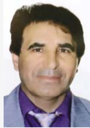
رئيس النقابة العامة للعاملين بالبترول والكيماويات الأردنية الأمين المساعد للاتحاد العربي للبترول والمناجم والكيماويات