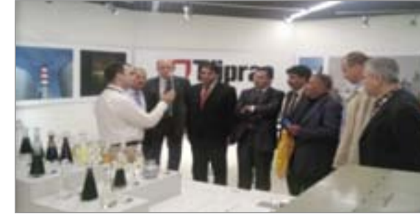
الانشطة التي تقيمها النقابة العامة وأبرز مشاركتها بامؤتمرات الدولية والوطنية وورش العمل والندوات