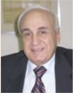
د. زيد حمزه وزير الصحة السابق